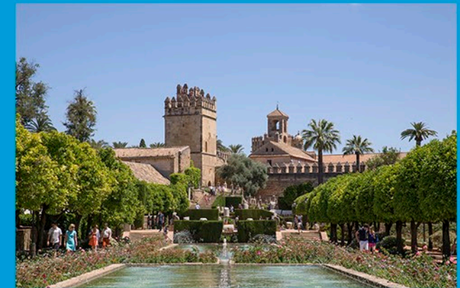
Alcázar de los Reyes Cristianos