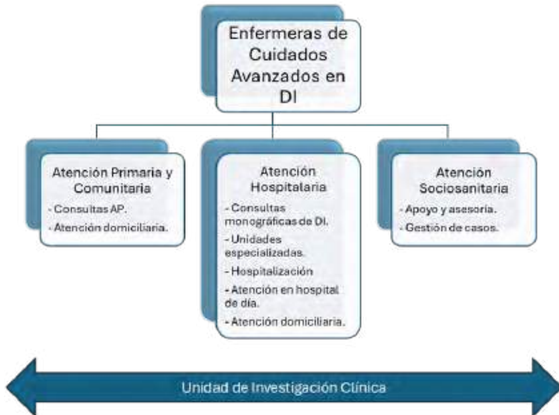
Figura 1. Ámbito de actuación de la enfermera en cuidados avanzados en la DI.